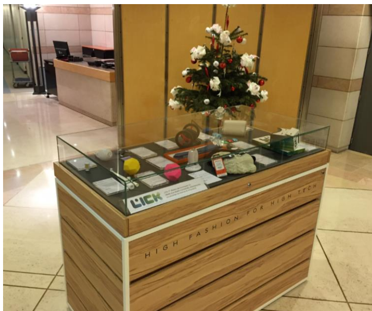
Table thématique objets connectés French Tech à l'entrée du bureau du ministre à Bercy