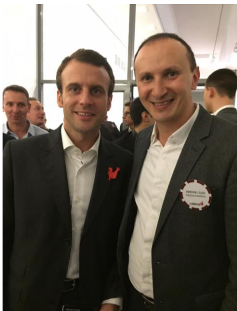
Soirée French Tech pré CES 2015.

Afin de promouvoir l'innovation française, LICK, 1 er réseau de boutique au monde dédié aux objets connectés, présente les produits de la FrenchTech déjà disponible pour les fêtes de fin d'année, au sein du ministère de l'Economie, de l'Industrie et du Numérique.